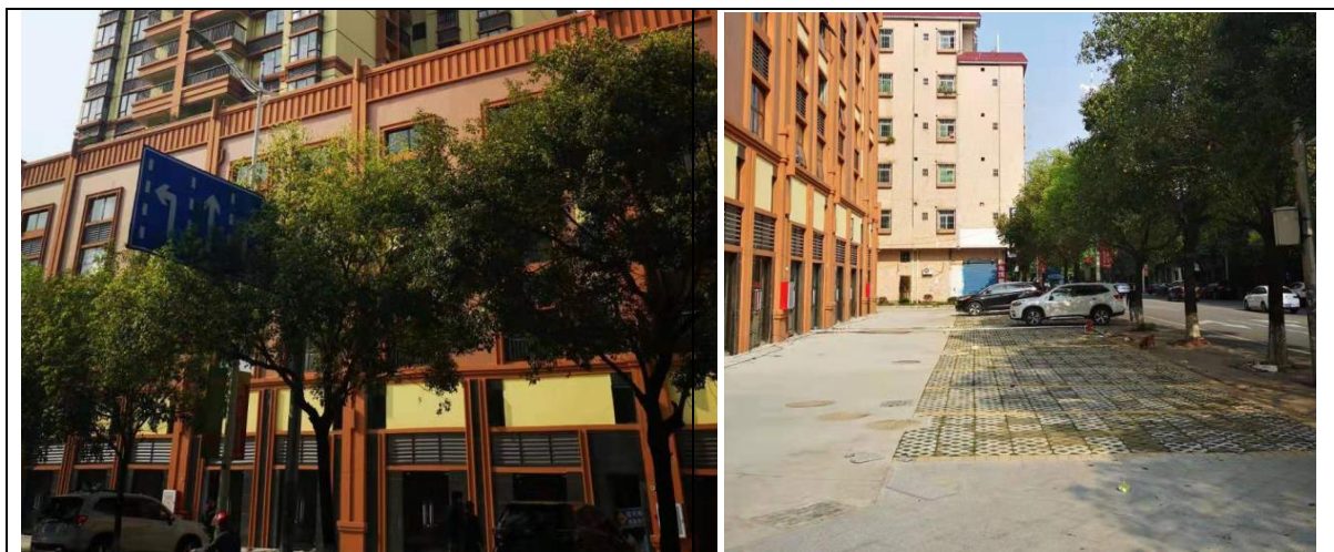
图 2-1 水土保持植物措施实施情况

经实地勘察监测，本项目工程施工后期，对建筑物周边、道路两侧、项目区内休闲区域等实施景观绿化，具体情况见图 2-1。